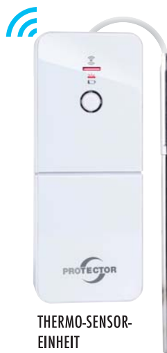
THERMO-SENSOR-EINHEIT FÜR OFENROHR