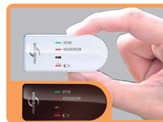
FENSTER SENDEGERÄHE ZUSÄTZLICH IN BRAUN BEIGEFÜGT